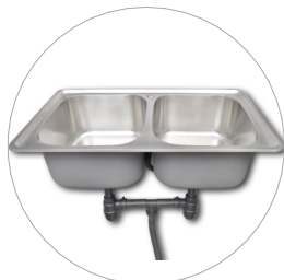
Nerezový dvojřez o rozměru 76,5x45 cm a hloubkou 31 cm, povrch stříbrný. AMX 120 Nerez | 122.0120.019 Viz. Kniha standardů 03