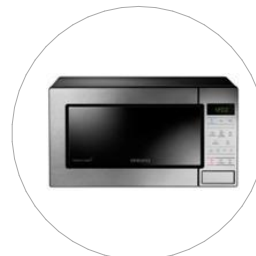
Volně stojící mikrovlnná trouba 48,9x27,5x32,4 cm, o hmotnosti 12 kg. MS23T5018A. Viz. Kniha standardů 03

*Uvedení konkrétního obchodního názvu nebo značky použitého materiálu a zařízení (dodávky), případně jiné označení mající vztah ke konkrétnímu dodavateli (výrobci), neznamená nutnost použití těchto konkrétních výrobků. Jedná se pouze o vymezení předpokládaného standardu (vlastností). To znamená, že všechny konkrétně uvedené materiály a zařízení mohou být nahrazeny výrobky jiných dodavatelů (výrobců) s podmínkou zachování shodných (tj. srovnatelných nebo lepších) technických, kvalitativních a cenových parametrů.