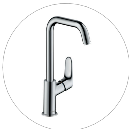
Páková dřezová baterie 240 s otočným výtokem a odtokovou soupravou s táhlem. Keramická kartuše. Viz. Kniha standardů 03