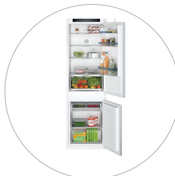
Vestavná chladnička s mrazákem uvnitř. Rozměry spotřebiče (VxŠxH): 1770 x 540 x 545 mm. 118.0656.683 Viz. Kniha standardů 03