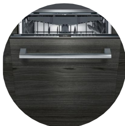
Plně vestavná myčka nádobí energie 2 / voda 3 : 84 kWh / 9,5 l kapacita: 13 sad nádobí (V x Š x H): 81.5 x 59.8 x 55 cm Viz. Kniha standardů 03